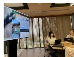
「最終報告会の様子」