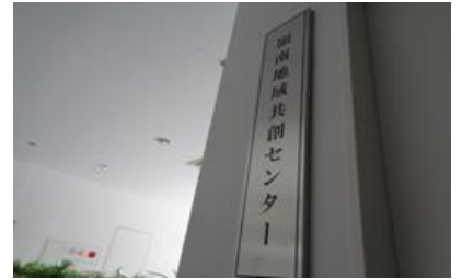
敦賀キャンパス「嶺南地域共創センター」

今後、嶺南地域における教育、研究事業、地域振興活動の拠点として、「敦賀サイト」「小浜サイト」を是非、活用下さい。